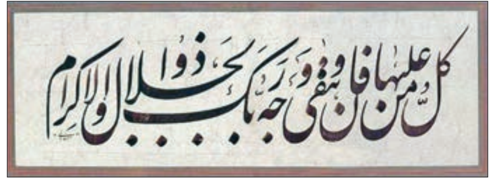
• الخط الفارسي