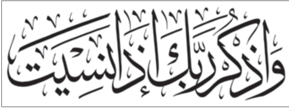
• الخط الديواني