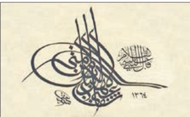
• خط الطغراء