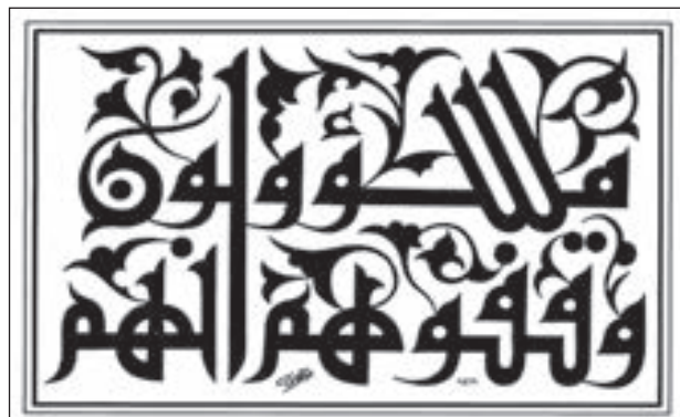
• خط كوفي