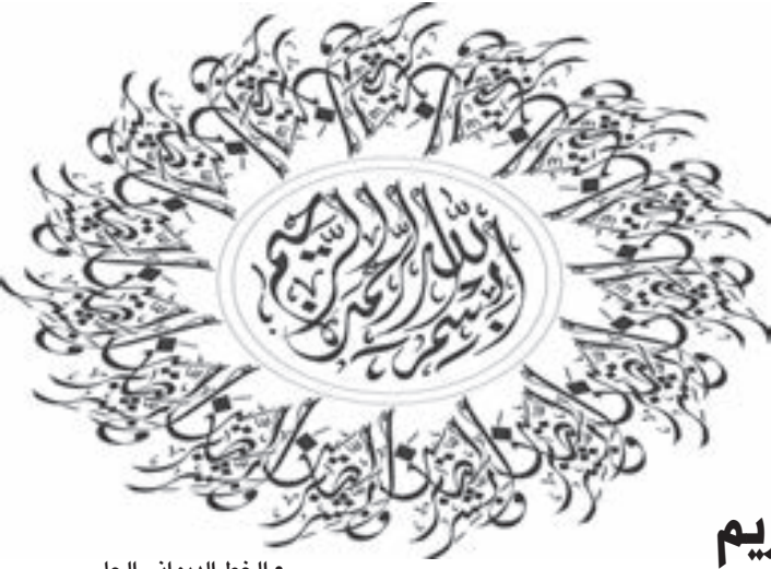
• الخط الديواني الجلي