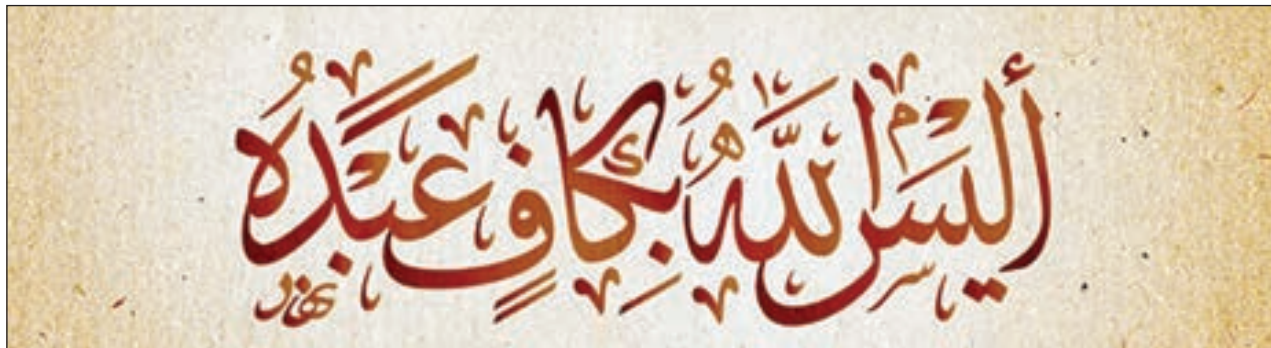
• خط الإجازة

١ - الخط الكوفي: وهو الخط المدني أو المكّي الذي انتشر في عهد الخلفاء الراشدين وخاصة في عهد الإمام علي «عليه السلام» ويقوم هذا الخط المصحفي على إمالة الألفات واللامات نحو اليمين وهو خط غير منقط في بداياته ثم تطور ليظهر منه: المزهري والمورق والمعشوق والموشح. ٢ - خط الثلث: وهو أصعب الخطوط وأكثرها جمالا ويمتاز بالمرونة ومناة التركيب وبراعة التأليف وحسن توزيع الحليات وبهذا الخط يتميز الخطاط الجيد ومن أنواعه: المنسوب والمحقق والريحان. ٣ - خط النسخ: وهو الخط المعتمد في كتابة المصاحف الشريفة خلفاً لخطي الكوفي والثلث ووضع قواعد هذا الخط هو العالم والخطاط «ابن مقلة». ٤ - الإجازة والتوقيع: وهو الخط المشترك بين الثلث والنسخ ووضع أساسه: يوسف الشجري في عهد الخليفة المأمون. ٥ - خط الرقعة: وهي كتابة سهلة قاعدية مسارها السطر لا ينزل عنه إلا حروف الجيم